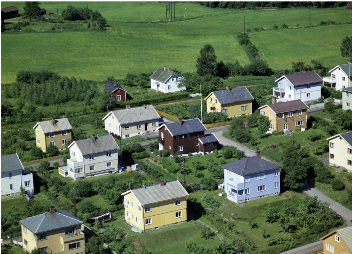
Solerud er det bakeste huset med et rødt uthus.