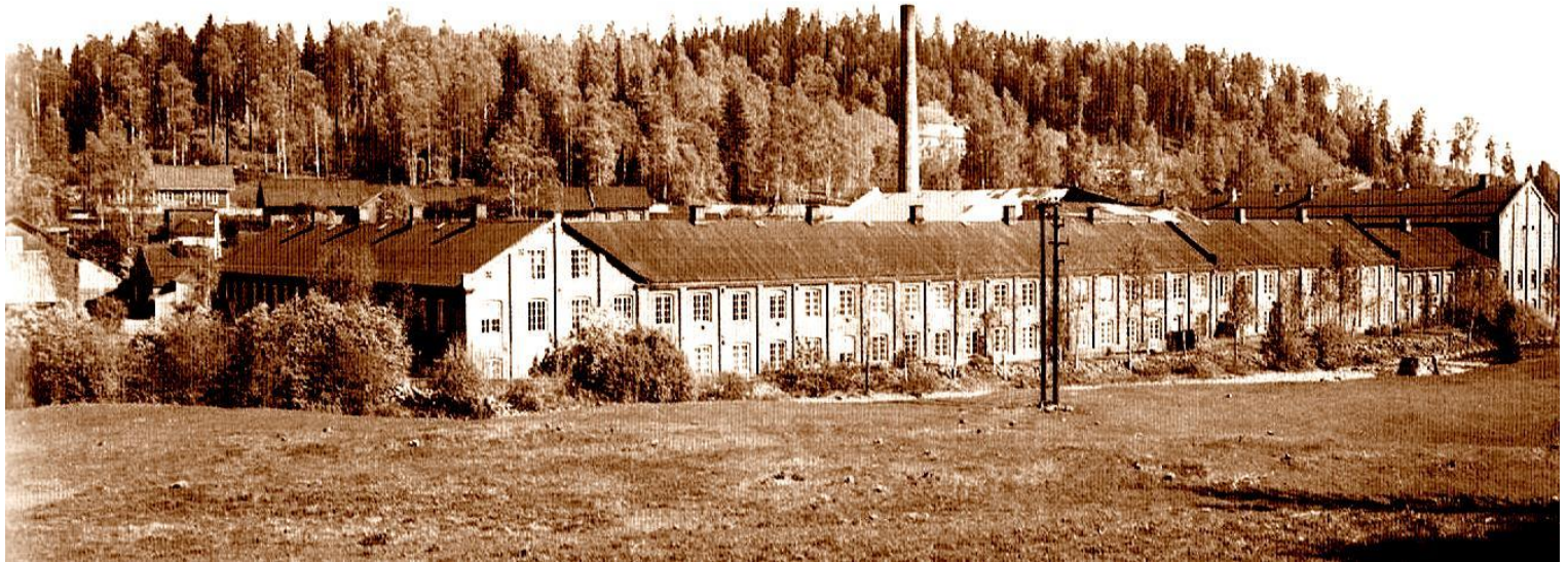
Lager- og pakkeavdelingen hos Mustad midt på 1930-tallet.