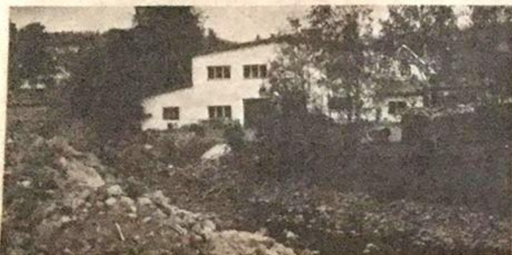
Gjøvik Metallindustri A/S har full produksjonsvirksomhet i lokalene ved Vesleelva.