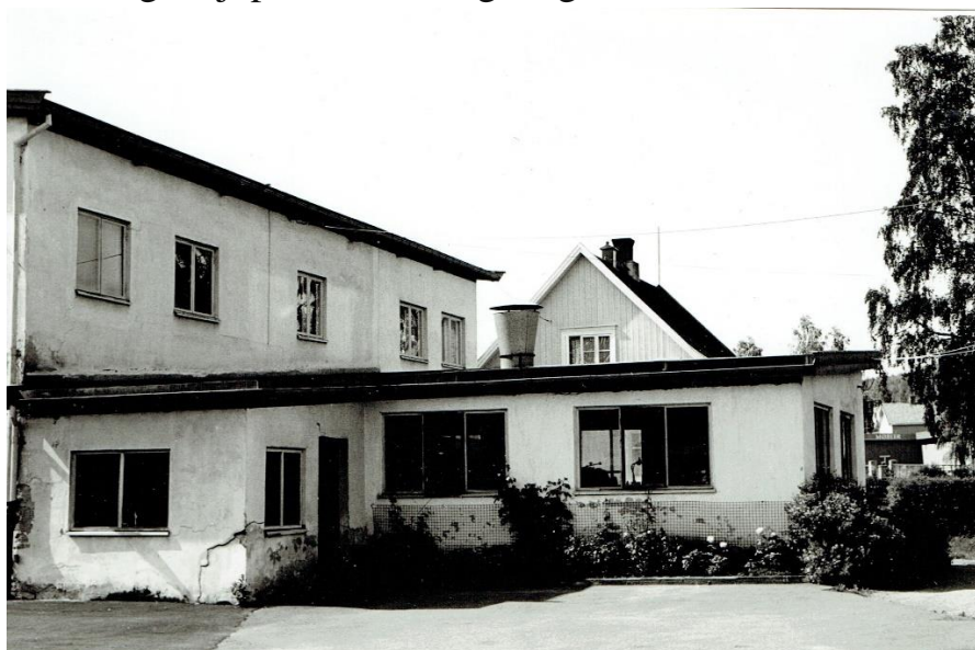
Fabrikken som firmaet Anton Christensen og Sønner bygde på Holm.