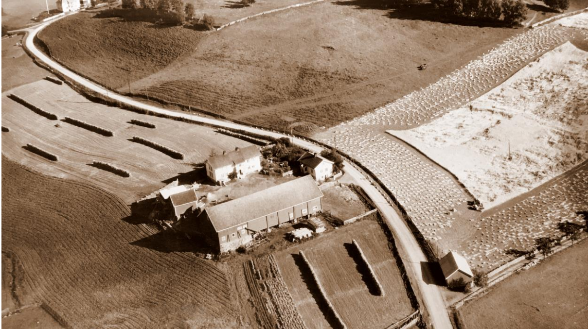
Vøien øvre gnr/bnr 249/1 i Gran

Gardsnavnet betyr iflg. Oluf Ryghs verk Norske Gaardsnavne enga ved vade- stedet.