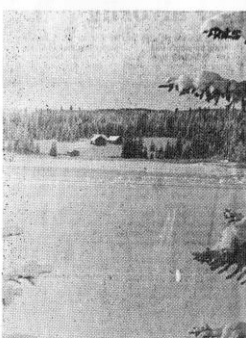
Nordsetra ligger idyllisk til i nordenden av Øyangen. På bildet ser vi bare en av seterhusene.