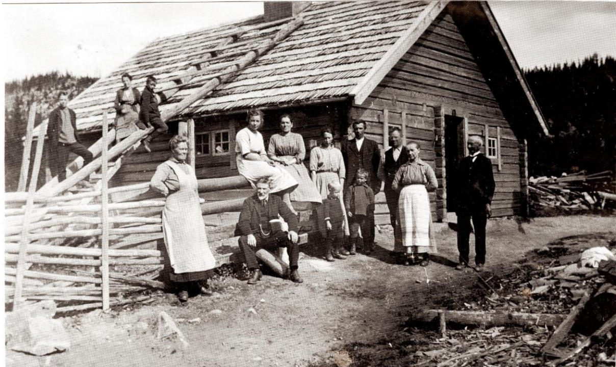
Setra på Øyangen i 1922.