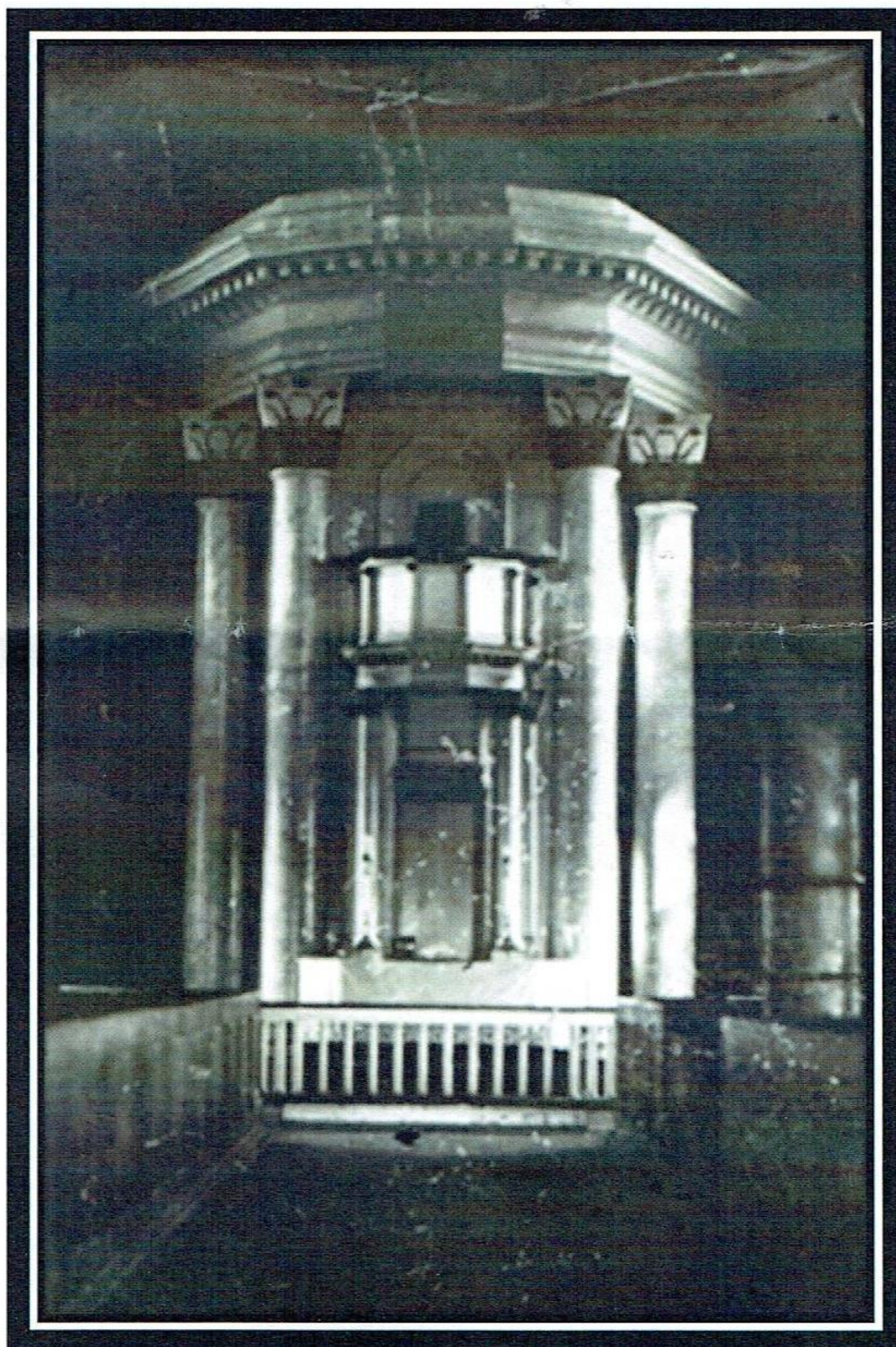
Alterpartiet i Hunn kirke med søyler og søyletopper