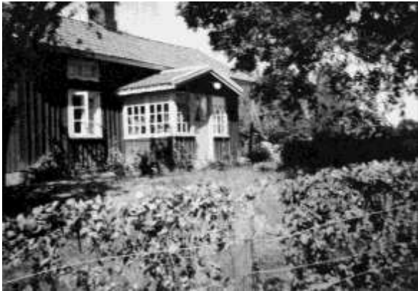
Huset på Tropperud.

Min minnesbild från mitten av 1940-talet om den gamla stigen som inte längre finns kvar och som vi kunde gå från mitt barndomshem Tomta, Binäs nr. 30, till farfar och farmor på Tropperud, Trombäljen nr. 3.