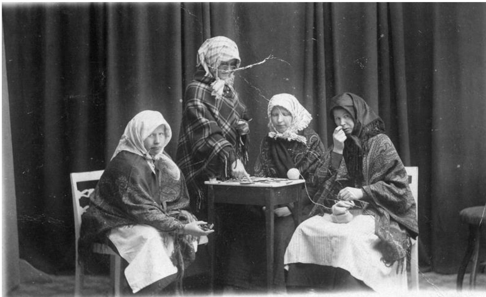
Ett skådespel från trakten. Okända skådespelare.