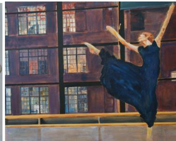
New York 2009