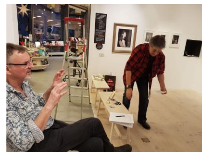
Bild tagen vid utställningens hängning.

Flera medlemmar har tagit del av utställningen genom fönstret under den stängda perioden. Vi kan glädjas över att vi skall få tillfälle att se utställningen i konstkuben återigen i sommar. (Om pandemin tillåter.)