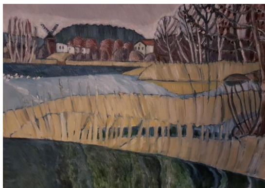
Mot gamla kvarnen, innan den brann ned, med vy från Örtagården över Kyrkfjärden. En flock skratmåsar just anlända på Vallentunasjön.

Hon målade natur- och stadsmotiv i olja, ofta med skarpa kontraster och kraftfulla uttryck. Hon var elev på Konstfackskolan på 60-talet och deltog därefter vid ett flertal separatutställningar i bland annat Stockholm och London. Hon har även varit representerad vid olika samlingsutställningar och hos företag.