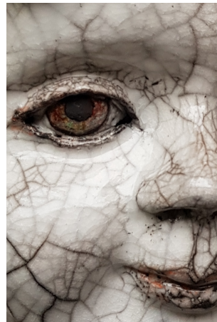
Detalj på rakubränt alster