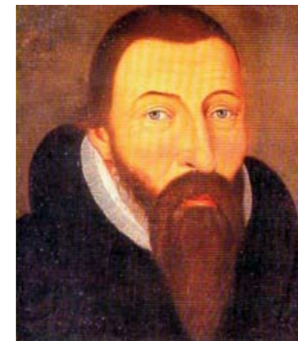
Bilde som befinner seg i Oslo domkirkes sakristi. Det forestiller antakelig biskop Jens Nilsson, selv om noen mener at det er av hans arvtaker.

Der hvor den ilende bekk vanner Vålens marker og de fruktbare åkrer utenfor byen Og hvor den uten å stanse går gjennom Oslos murer Kan vandreren se kommer fra Øst Fra bakketoppen se de befestede tårn Der hvor solen dukker ned i de vestlige vann Og fjernt borte ser han en gyllen stjerne