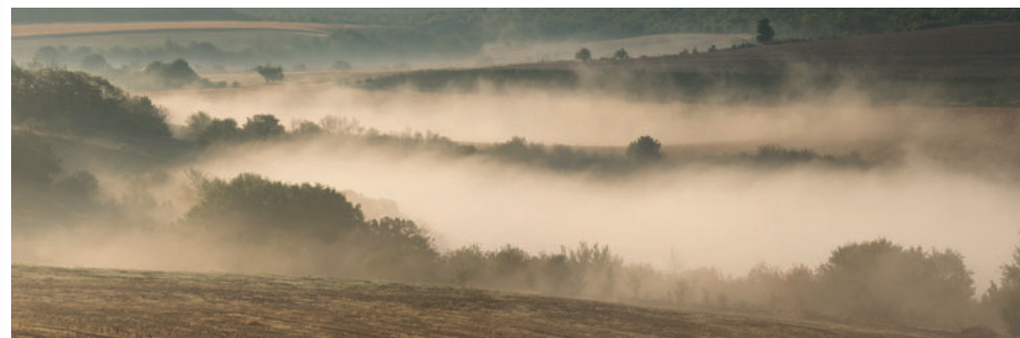
Het landschap van Rusenski Lom.

Uiteindelijk kocht ik er een huis en later een tweede. Het waren de unieke ligging – op een zuidelijk georiënteerde helling aan de rand van het dorp – en de rijke natuur in de onmiddellijke omgeving die me overtuigden. De lage prijs gaf de uiteindelijke doorslag. Het huis was al acht jaar onbewoond en de tuin was dichtgegroeid met hemelbomen, maar met een beetje fantasie kon je de vallei zien opdoemen. Al moest je maken dat je niet per ongeluk in de voormalige opvangvijver voor karpers terechtkwam. Onlangs is er een tweede gastenverblijf gerealiseerd.