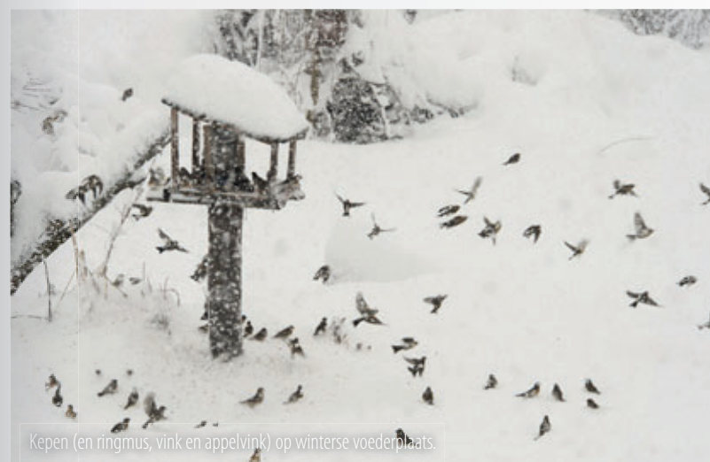
Kepen (en ringmus, vink en appelvink) op winterse voederplaats.