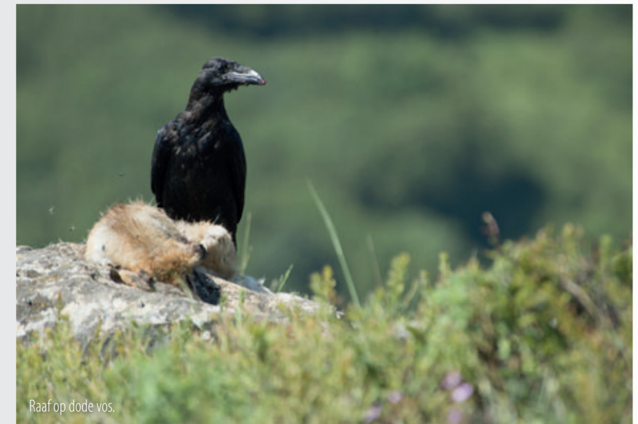
Raaf op dode vos.