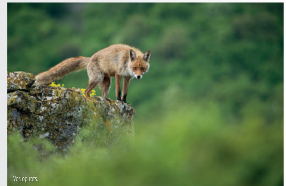
Vos op rots.