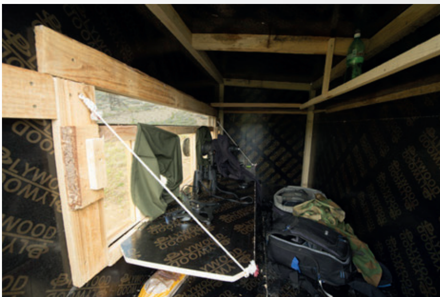
Bouw van de fotohut.