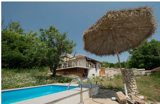
'Probuda' heet het vakantiehuis, wat 'aangenaam ontwakken' betekent.