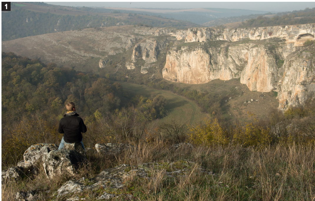
1 Genieten van een machtig uitzicht tijdens Ludo's Grand Cru-wandeling.