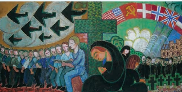
Henry Heerup (1946): Befrielsen og Freden

I år falder 4. maj sammen med Bededags aften. I Rejsby kirke tænder vi traditionen tro lys og markerer dagen for Danmarks befrielse 1945 og beder for dem, der i vor tid lever i krigens skygger. Gudstjenesten begynder kl. 19.30, bagefter byder menighedsrådet på kaffe og hveder. Alle er velkomne!