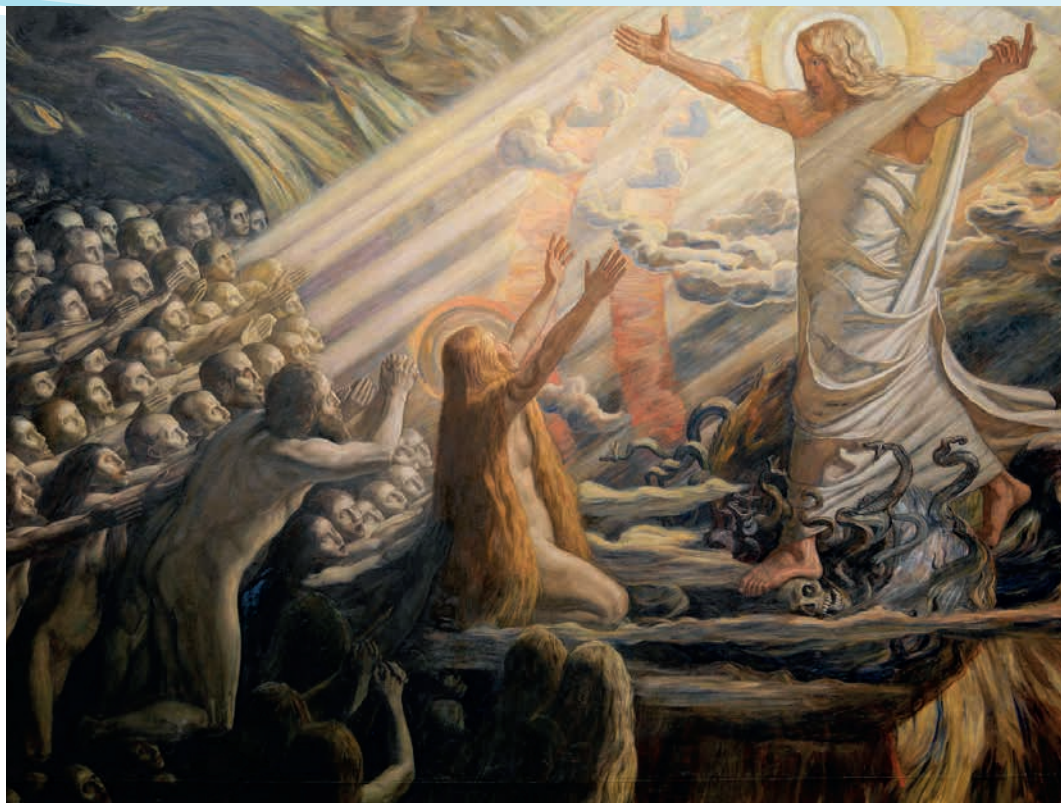
Joakim Skovgaard: Kristus i de dødes rige (1891-94) © Statens Museum for Kunst

sang og ord på skift reflekterer Langfredags begivenheder: Jesu korsfæstelse og død. I år medvirker begge pastoratets præster ved gudstjenesten i Rejsby kirke.