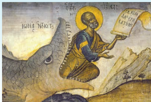
Ill.: Jonas i hvalfiskens bug – hvad har han med Jesus at gøre?

Bibelen er kristendommens hovedværk, men den kan være svær at komme i gang med at læse. For hvor skal man begynde og hvordan skal man forstå det, man læser? Der er mange forskellige slags skrifter i Bi-