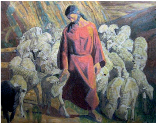
Niels Larsen Stevns: Den gode hyrde

Roager Kirke onsdag 4. maj kl. 17.00 er der gudstjeneste for børn (og deres voksne). Vi skal høre om den gode hyrde og selv prøve at være hyrder for hinanden og får, der skal findes. Efter gudstjenesten er der aftensmad fra bål til alle.