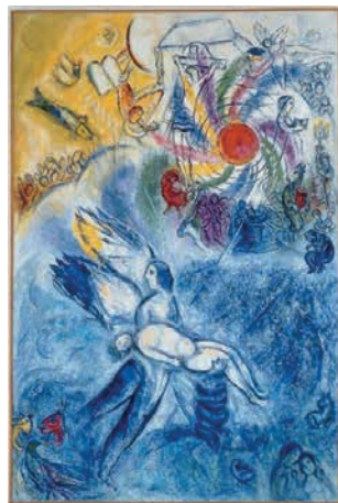
Marc Chagall: Menneskets skabelse, 1958