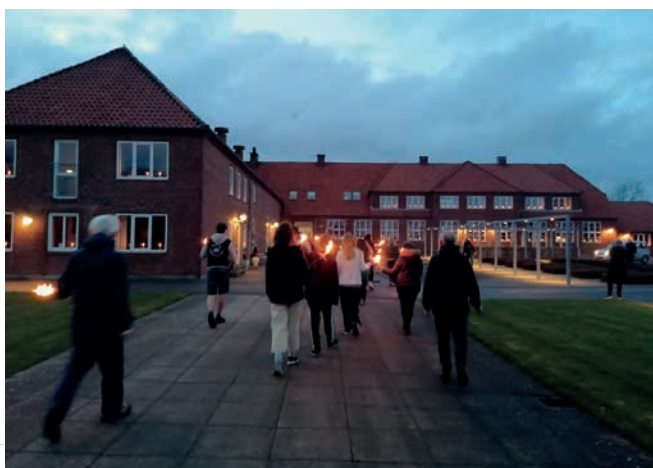
Glimt af befrielsesfejringen i Rejsby 4. maj 2021.