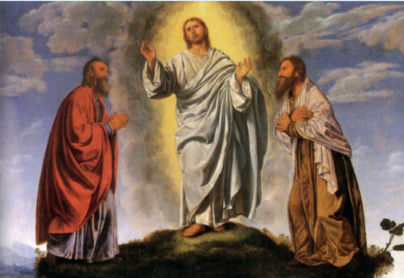
Jesus med Moses og Elias. Udsnit af maleri af Girolamo Savoldo, 1530.