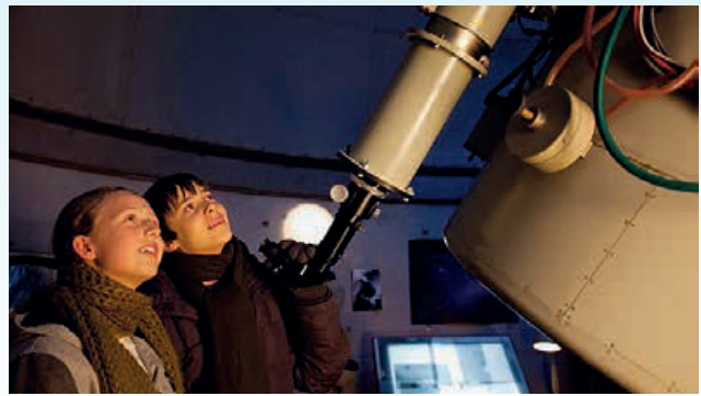
Børnene Sus og Bob har fået øje på en kæmpestjerne, som de studerer gennem teleskopet i Brorfelde Observatorium i årets tv-julekalender, Julestjerner

Julenat, da Jesus blev født, stod en særlig klar stjerne og lyste over Betlehem. Det var ikke en nat som de andre, det var en vidunderlig nat - som om hele skabningen holdt på sit vej. Himlen blev åbnet af lys og af lyd, og man så engle i tusindvis vandre rundt i stjerneskedet.