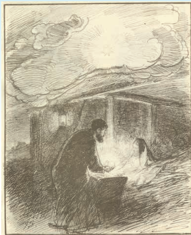
"Den signede stund den midnatstid", af J. Skovgaards ill. til salmen Den signede dag kilde: kristendomsundervisning.dk

Sådan er vi i kirken altid opmærksomme på, at den høje tid er indfældet i enhver tid, det evige er ikke noget, der først begynder engang på den anden side af døden eller ved verdens ende. Nej det evige har sat sig igennem i tiden. Gud vil være Gud med sit menneske i det liv og på den jord, vi mennesker lever. Vi møder ham allerede her. Og derfor er hver dag, både de høje og de lave, de gyldne og de grå velsignede eller signede, som vi synger i den gamle dagvise. Heraf