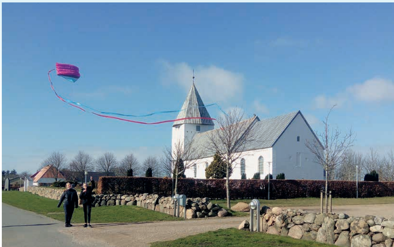
Konfirmander sætter drager op ved Rejsby Kirke, forår 2019.

Sådan lyder første linje i en nyere sommer-salme af Lars Busk Sørensen. Og dermed er meget sagt om indholdet af dette nummer af kirkebladet: