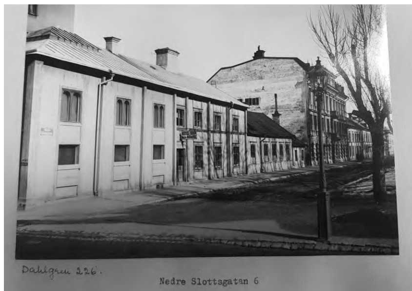
Fig 2 och 3 visar gatubilder från Östra Ågatan och Nedre Slottsgatan vid tiden för denna historik. (alvin-portal.org)

Georg Døvertii , nr 265, f.d. 21 mars 1825. Fadern kyrkoherde. Civ. cod. 1844, med. fil. 1849, med. lic. 1860. Stadsläkare i Upsala 1859. Var ägare till den fastighet där Göteborgs nation var inrymd vid Drottninggatan. Avsked 1895 och död 1896.