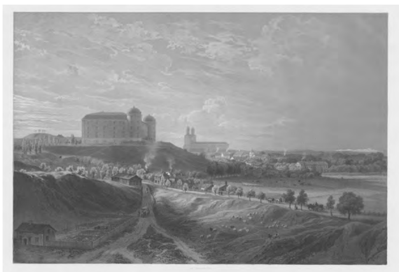
Fig.6. Uppsala var en liten stad med låg bebyggelse och de flesta anbildningar från första hälften av 1800-talet visar de monumentala byggnaderna. Denna bild visar staden från söder. Litografi, Billmark (alvin-portal.org)