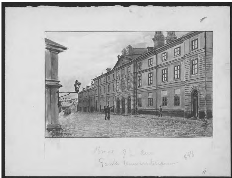
Fig.5. Konsistorium vid S:t Eriks torg. Här hade föreningen sammanträden och här förvarades biblioteket. I nedre våningen ägde obduktionerna rum. Huset kallades även Kuggis. Kungliga vetenskaps societetens hus med lykta skymtar t.v.