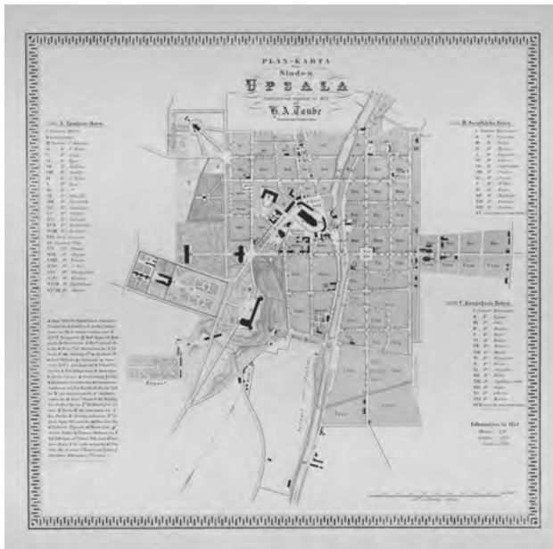
Fig. 5. H. A. Taubes karta över Uppsala från år 1855. Staden hade c:a 12 000 innevånare.