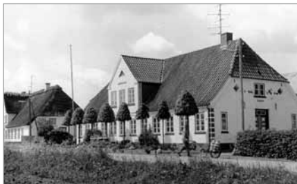
Spang 27 med lindetræerne

Fra 1878 var gården ejet af fire generationer Kock.