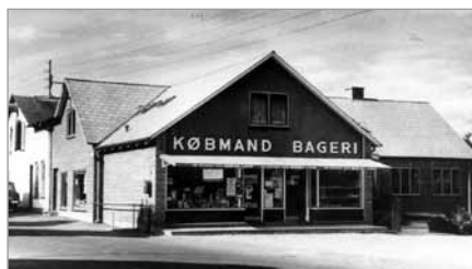
Købmand og bageri, 1975