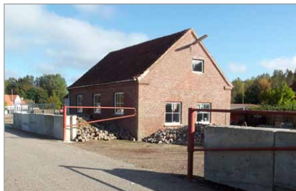
Spang 14 set fra Spang