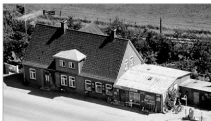
Spang 8, købmandsbutik, ca. 1970