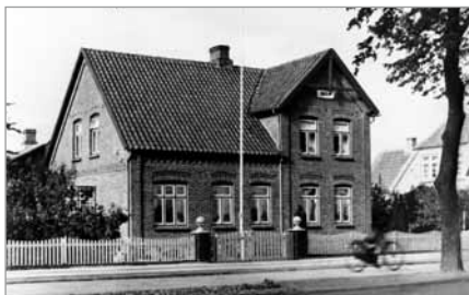
Spang 5, opført 1923