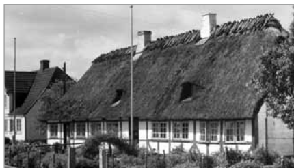
Kirkestien 17, ca. 1960