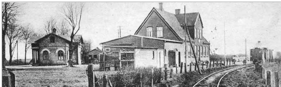
Spang Station, Amtsbanen, indtil 1933. Bomhuset til venstre