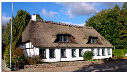
Spang 29, Grynmøllen