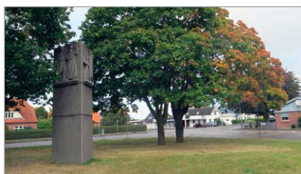
Genforeningsstenen på den nye plads