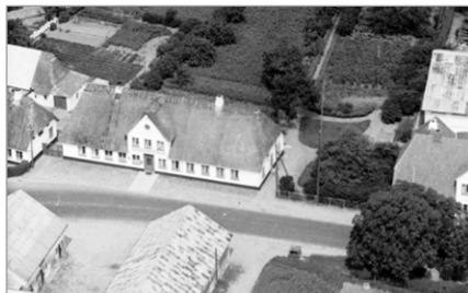
Spang 25 med stalde på den modsatte side af vejen

I 1963 blev vejen lagt uden om kroen, og da Ulkebøl i 1970 kom under Sønderborg kommune, faldt besøgstallet, og kroen lukkede. Bygningen står der stadig, nu som beboelse.