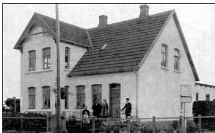
Kirkevej 9, før 1933

I arkivet gjorde de gamle bøjler god nytte.