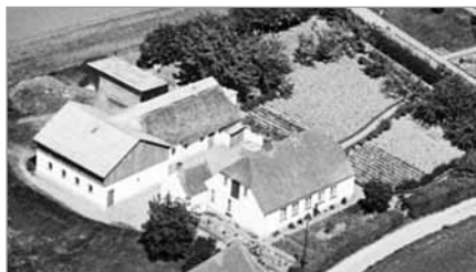
Tidl. Kirkestien 7, nu Østkirkevej 10