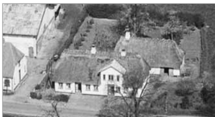
Spang 29, 1938