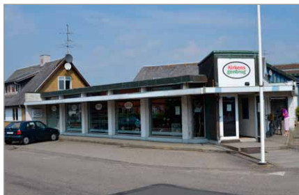
Spang 11, 2013