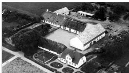
Spanggaard, ca. 1950