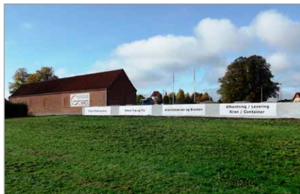
Spang 14 set fra Augustenborg Landevej

9 Bomhuset lå ved indkørslen til Nordborgvejen til venstre og Mommarkvejen til højre.