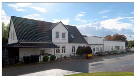
Spang 8, Rabøl