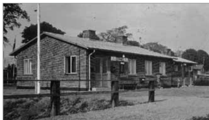
Spang Station, Mommarkbanen