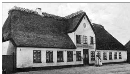
Spang Kro, ca. 1933