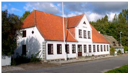
Spang 27, Lindegaard

7 Spang 29 . I 1804 oprettedes der en grynmølle i bagbygningen til ejendommen. Den blev trukket af en hestegang og var i brug indtil 1880.