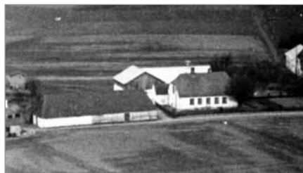
Kirkeladen og Skovmands gård