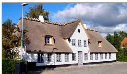
Spang 25, Spang Kro