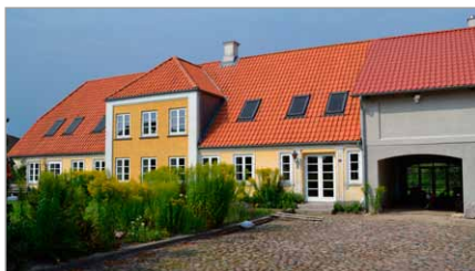
Kirkestien 13, Spanggaard