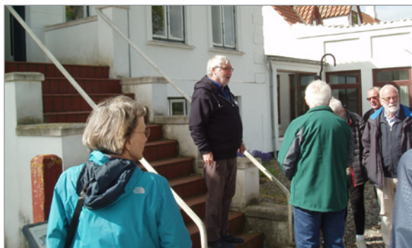
Rundvisning på værftet

Efter frokosten kørte vi til Jacob Michelsens Gård, hvor vi på en rundvisning hørte om og så, hvorledes der blev arbejdet og levet på gården i tidligere tider. Gårdens historie går tilbage til 1500-tallet, mens museet er startet i 1958