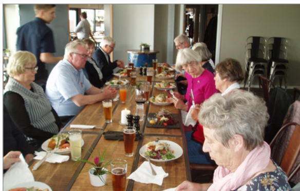
Frokost på Under Sejlet