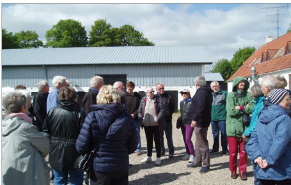
Rundvisning på værftet