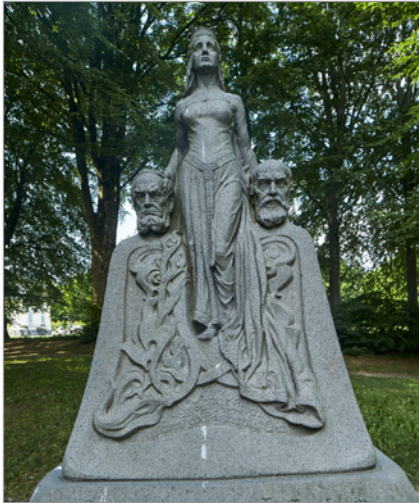
Niels Hansen Jacobsens monument over "Modersmålet" i Skibelund krat

Herefter går turen til Skibelund Krat , hvor vi spiser frokost på Hotel Skibelund Krat . Der serveres wienerschnitzel + efterfølgende kaffe. Hotellet ligger i Skibelund Krat, som sammen med Askov Højskole