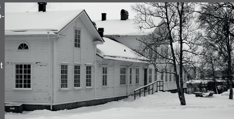
Källa: Mats Dahlberg Text & bild: Ebba Lindmark, Natalie Lidström

Tusen Toner arrangerar Kirunafestivalen sedan åtta år tillbaka. Innan föreningen tog över festivalen, arrangerade kommunen en festival som inte blev så omtyckt. Det skickades ut enkäter till ungdomar angående en ny festival. Ungdomarna var positiva till det och år 2000 genomfördes den första Kirunafestivalen. Det blev en succé och idag har Kirunafestivalen en stor betydelse för föreningen. Idag är det viktigaste för föreningen att de får in nya medlemmar. Det är den nya generationen som ska utveckla verksamheten.