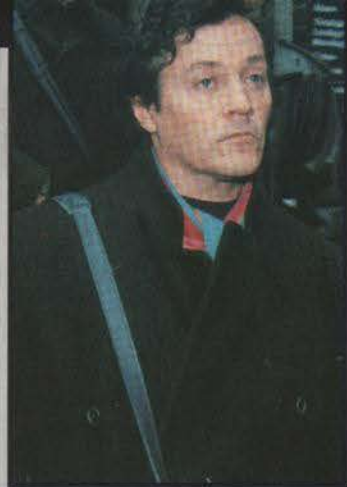
Skuespilleren Jess Ingerslev kom alene til bisættelsen i Arbejdermuseets festsal.