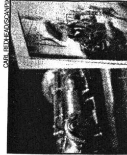
Det er i år 10 år siden, at Dan Turèll døde bare 47 år gammel.