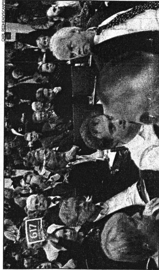
Der var et stærkt fremmøde hos Bruun Rasmussen Auktioner Havnen, da Dan Turèlls ejendele i går blev solgt for den samlede sum på 860.000 kroner. Vurderingen var sat til 200.000 kroner.

Auktionshuset havde efter en venlig henstilling fra politiet fjernet hashklumperne fra auktionen og i stedet doneret dem til Politihistorisk Museum. Den detalje havde formentlig frydet Turèll, der har skrevet mange humoristiske krimier.