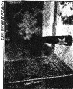
Turèlls rygegrej, deriblandt en chillum, gik til 15.000 kroner.