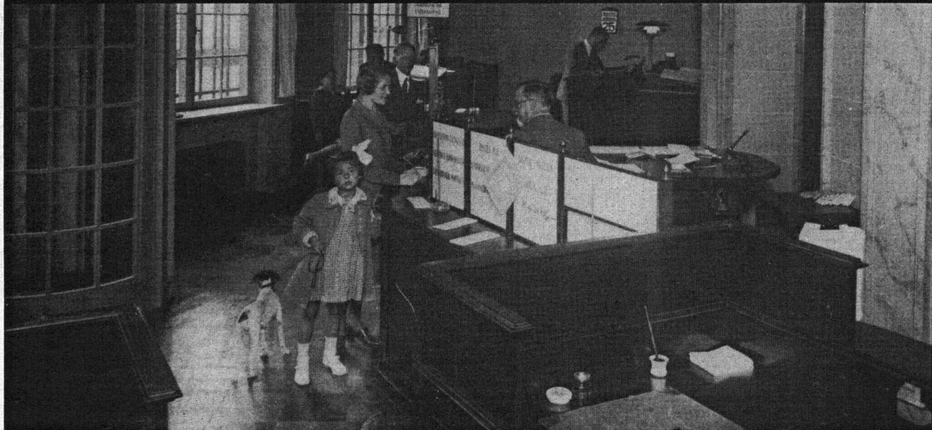
Charlottenlund afdeling, 1928.

Charlottenlund afdeling Jægersborg Allé 22 2920 Charlottenlund