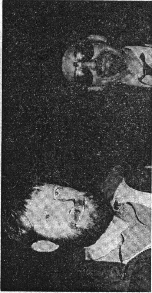
Politikens fotograf Lars Skaaning var med landsholdet i Sovjet, og det var...

forfatteren Dan Turéll også for at skildre stemningerne udenfor fodboldbanen.