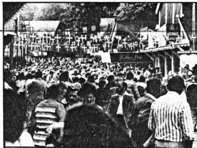
Bakken – en ångande häxgryta

hem med ballongerna och kvällens sista fyrverkeri förbereds.