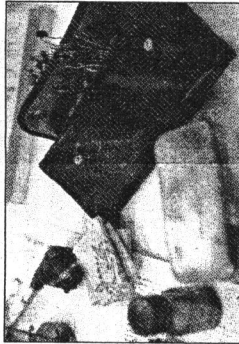
Rygegrøjet var der og gik for en del mere end forventet...