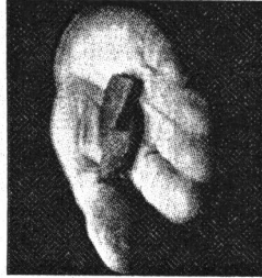
- Men ingen brun Marokko her, sagde auktionarius.