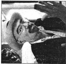
En mand - Dan Turell -