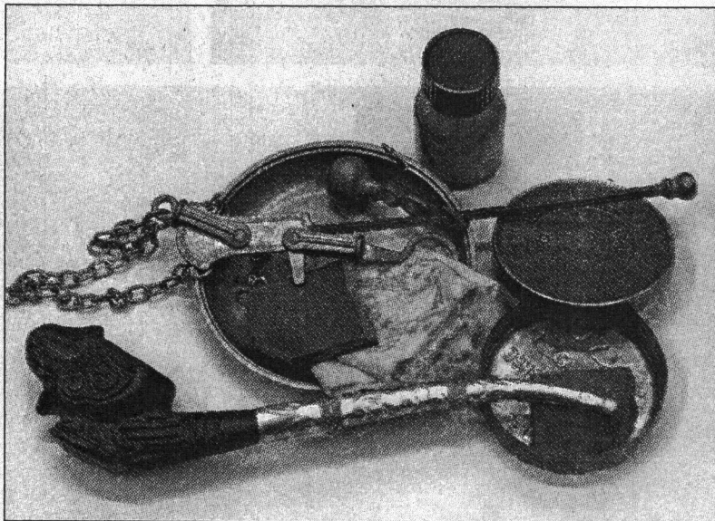
RUSMIDLER – Dan Turélls hashpipe med elefanthoved i keramik sælges sammen med andet bevidsthedsudvidende udstyr som vægten i messing, det apotekerbrune snifglas med betænkeligt, hvidt indhold og to klumper indtørret hash, der har mistet effekten med årene. Hele pakken er vurderet til 1000 kr.

Der er lagt op til lidt af en københavnerbegivenhed på onsdag, når Bruun Rasmussen i havnen svinger hammeren over Dan Turélls kontor. Til tonerne af Onkel Dannys gamle LP'er kan man byde på alt fra skrivemaskinen og Bogart-hatten til gribben Gilbert og to klumper indtørret hash.