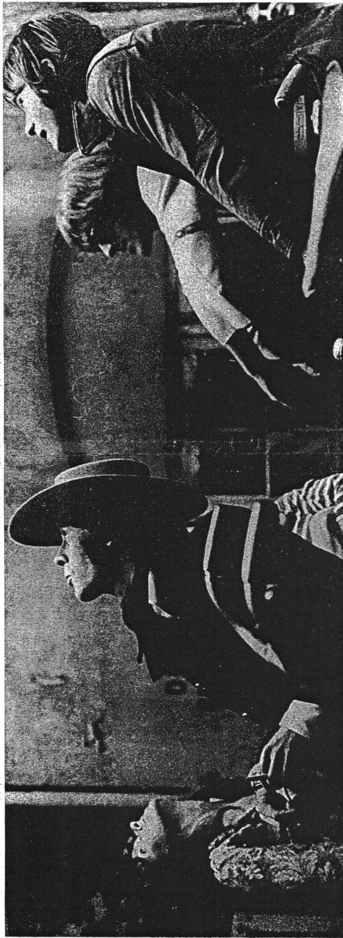
'The Airplane var eksponent for selvaste The Francisco Sound, denne specielle lyse, lette, søvne, drømmende tone'.