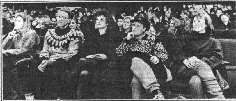
Reykviskir nemendur fylgjast með skemmtun Turéll-hjónanna í gær.