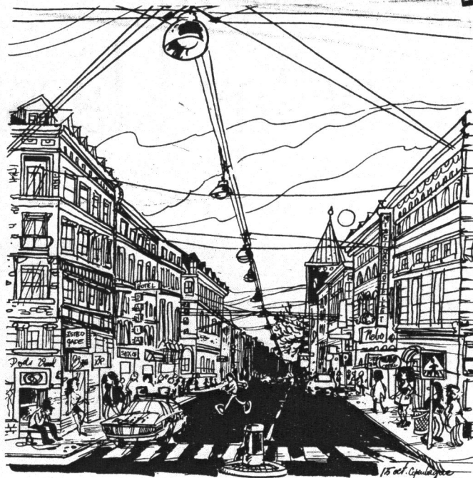
"Du får min pick jag får ditt preludin O.K. Sânt är livet på Istedgade"

Jag kunde ha levt ett helt liv på Istedgade och ibland tycker jag jag har gjort det och att det inte var något dåligt liv. Istedgade har sin egen rytm en rytm som ett lite hest lätt hjärtat positiv som inte desto mindre spelar vidare och fortfarande kan dra sina valser till de förbipasserandes förnöjelse och det finns två slags förbipasserande och två slags människor på Istedgade i varje fall på min del den del som är nattvårdshus och liveshower där finns det två sorter: dom som hör dit och dom som kommer dom som hör dit är fnasken som hänger i dörrarna eller väntar i gathörnen och bjuder ut sig utan nämnvärd blygsel men också utan nämnvärt ögonblänk dom står där och säljer sig som om dom vore tjockisen i nattkiosken han som med samma likgiltiga ögon säljer öl och cigaretter på precis samma sätt och den sortens ögon är det gott om på Istedgade ögon som ser allt och säger inget ögon som vuxit samman med denna gata och dess speciella liv ögon som sett så mycket fnaskande så många fyllon