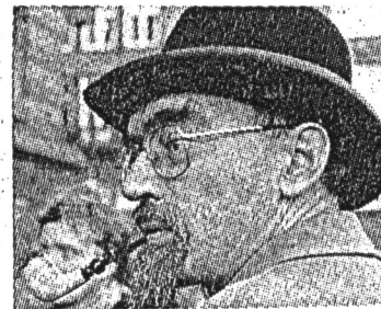
Dan Turèll skriver om forfatterne.

I disse uger bringer Magasinet en lille sentimental rejse i en ganske særlig stil: De amerikanske journalist-fortælleres. Serien er udvalgt og kommenteret af Dan Turèll.