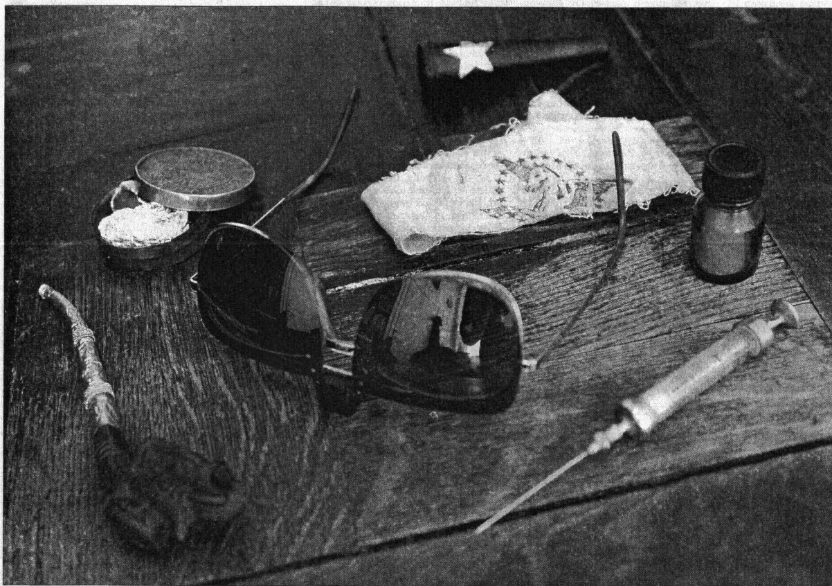
FRA DIGTERENS VÆRKSTED. Effekter fra Dan Turèlls skrivebordsskuffe. Tjald, chillum og solbriller og andet grej.

»Poetry day«. Sådan skrev Dan Turèll ud for den dag, der blev den sidste i hans liv. Notaterne i digterens 16 efterladte kalendere vidner om en skæv, nærværende og engageret eksistens. Travlt optaget af kunsten, mystikken og poesien i tilværelsen. Alt er med. Nu er det hele til salg.