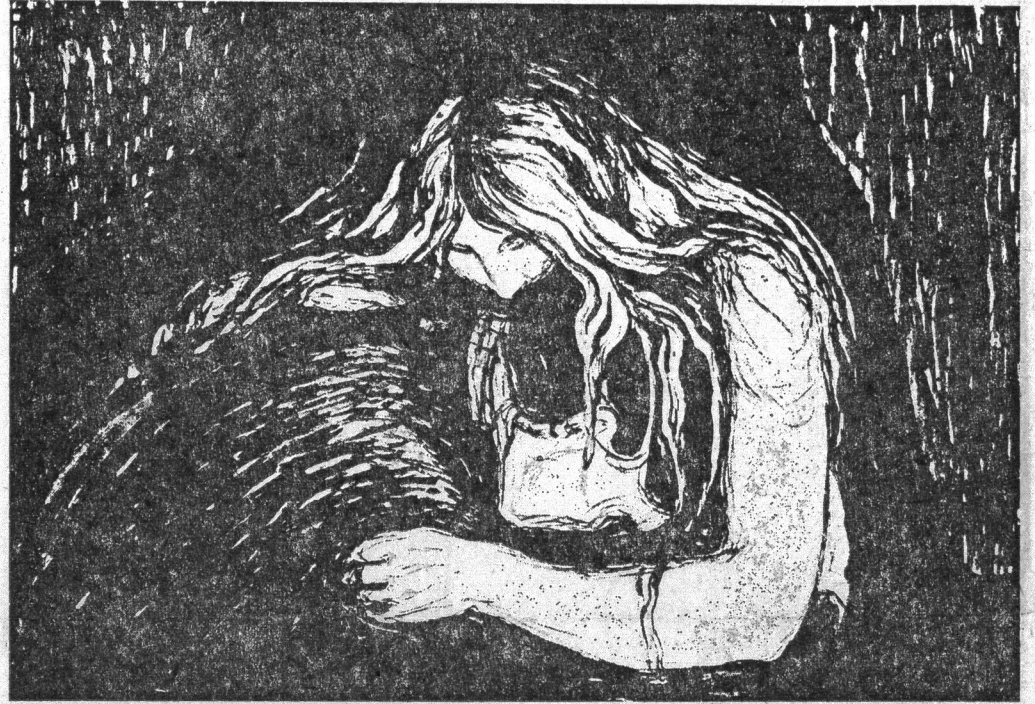
Edwards Munchs maleri 'Vampyr' fra 1895. Egentlig er det bare en rødhåret model, der kysser en ven af Strindberg i nakken. Det var nærliggende at kalde maleriet 'Vampyr', for Strindbergs figur, 'Froken Julie' for eksempel lægger jo ikke skjul på, at hun elsker at se mandsblod flyde ...

Og sikken et selskab, der var til stede, da den første vampyrroman løb af stabelen. Det var i Schweiz i juni 1816, i Villa Dio-