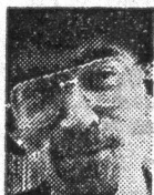
AF DAN TURÈLL FORFATTER

Det sidste lod til at være det almindelige motto, og jeg tænkte jeg hellere måtte gå videre, om ikke andet så for afvekslingens skyld. Det lader til, at jernbane-restauranterne de sidste år er ble-