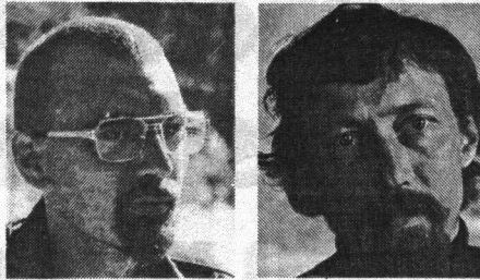
Af Dan Turèll