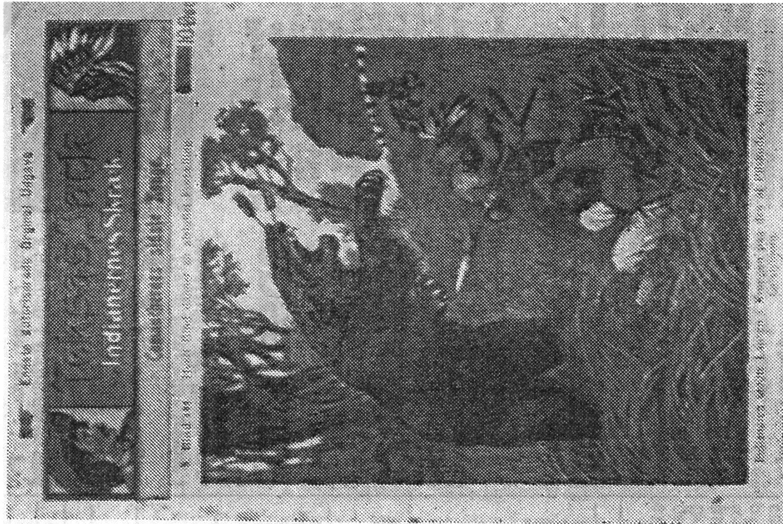
Nu er den kommet — bogen om de gamle kulørte hæfter