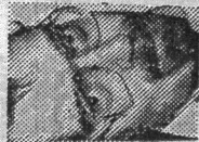
AF DAN TURÉLL