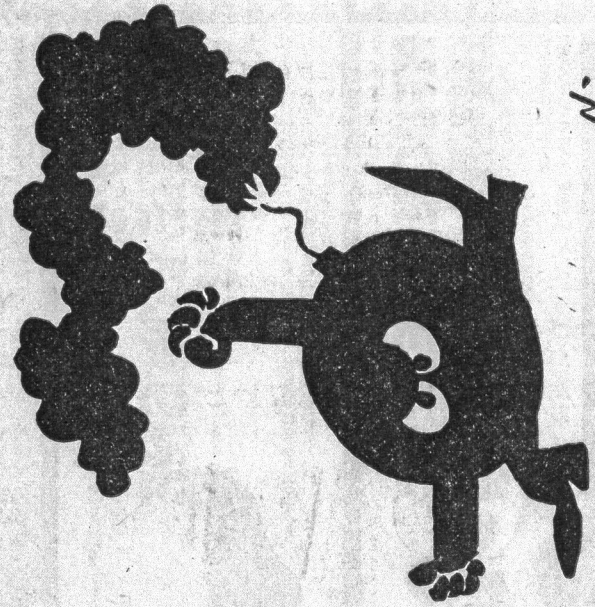
Tegning: Peder Nyman

Forhåbentlig ramte den ikke nogen. Jeg flæede ham væk. To minutter efter var han sig selv igen: dybt ulykkelig over det passerede, rolig, forstod ikke hvad der gik af ham.