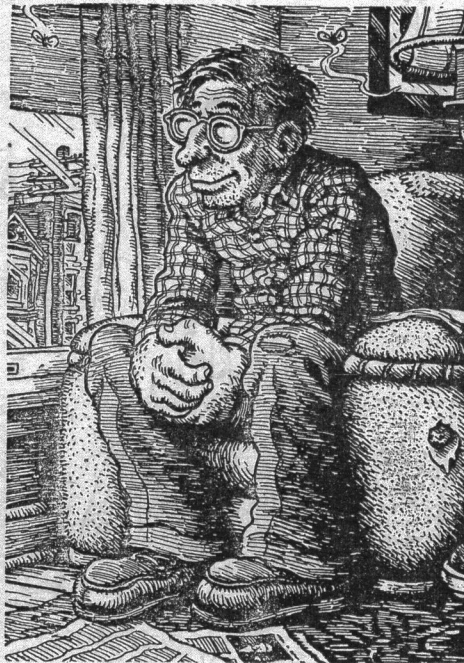
Selvportræt af R. Crumb