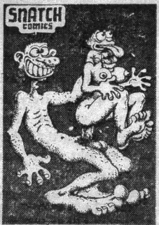
Et typisk Crumb-knald.