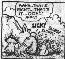
Liderlige Lone Lårkort sætter en ko i arbejde.

I SERIEN Joe Blow, f. eks., opdager Far og Mor, at Søn