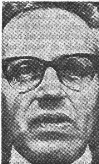
Den ungarsk-amerikanske Komponist György Ligeti

GRUNDEN TIL disse overvejelser er, at man forleden i svensk TV kunne opleve et lille mirakel: En stiv times udsendelse om den ungarsk-amerikanske komponist György Ligeti, produceret i England. Ligeti — Greatest Hit efter min