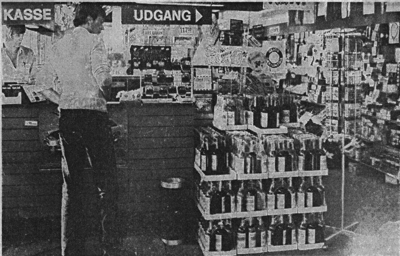
'Døgneren' blev fortid 30. juni kl. 0.00.