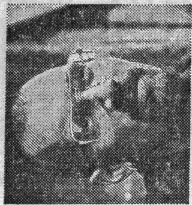
Dan Turell i byen

Så løb han hjem igen for at checke, lige pludselig rasende på hende. Her havde han løbet og løbet og hvad havde hun gjort, og hvis hun nu ikke var hjemme, så skulle han søge ... Det var hun ikke. Han gik op og ned ad gulvet i rasende fart og traskede tæp-