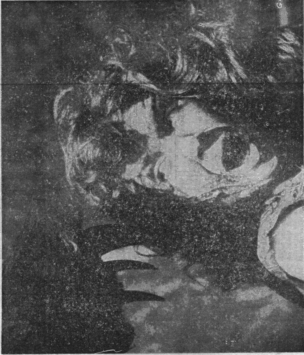
Fra den nye rædselsfilm Dødens Klør. Heltinden får øje på kløerne på en seks meter høj bjørn.

Der er jo muligheder nok, og der skulle da ikke være nogen