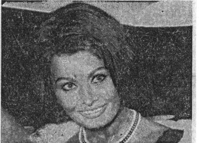
Sophia Loren — genbruges