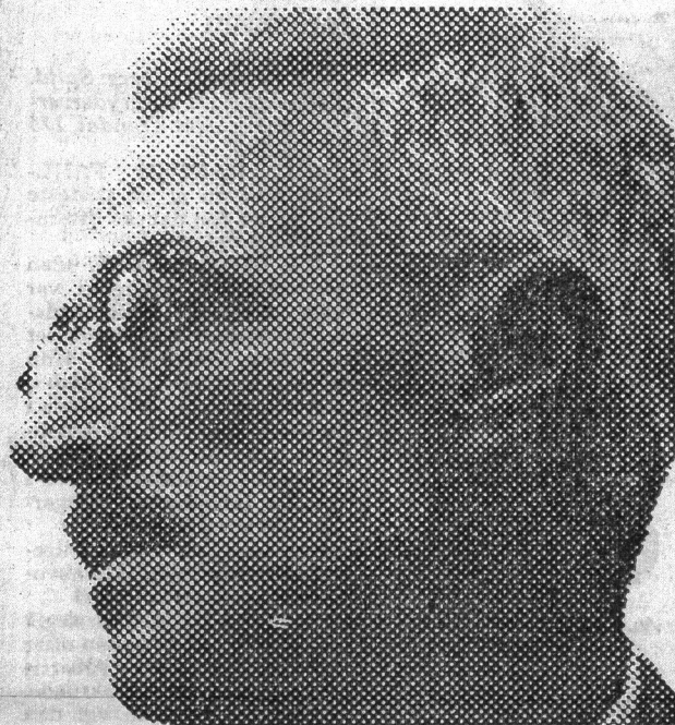
Dashiell Hammett — beskrives

ren til bl.a. klassikeren 'Den maltesiske falk'. Filmen skal have Hammett som hovedperson, beskrive hans liv og hans bøger, med Francis Ford Coppola som producer, Wim Wenders som instruktør og Frederic Forrest som den 'tynde mand' alias Hammett. Filmen har i sin lange udviklingshistorie foreløbig krævet tre manuskriptforfattere. Det er kun et par år siden, vi sidat så Hammett fremstillet på film — som bifigur i filmen om hans livsvarige veninde Lillian Hellman, 'Julia'.