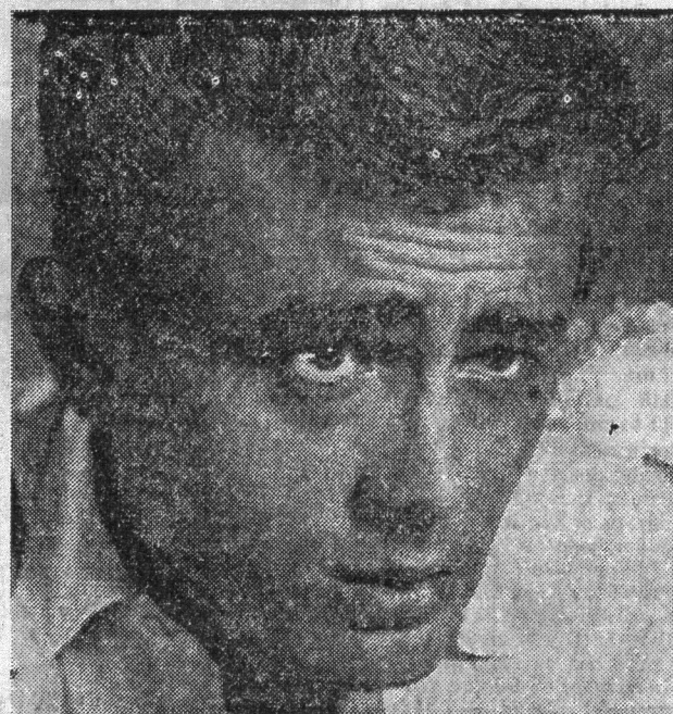
James Dean — genoplives