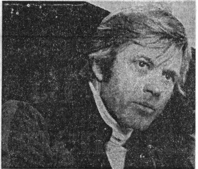
Robert Redford — debuterer

EN AF efterårets gysere — Fade to Black — handler iøvrigt om en ung mand, der ustandselig forveksler sin veninde og Marilyn Monroe i en