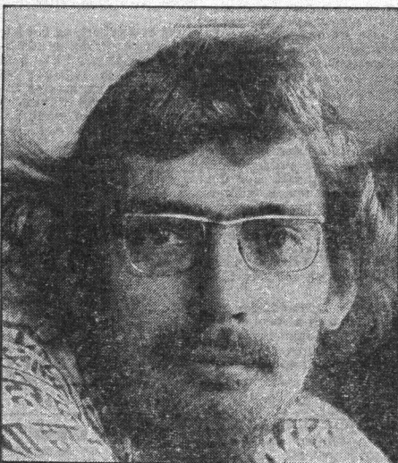
Dan Turèll i 1973, før reklamenumeret med det skaldede hovede og de sorte negle. Bog nr. 20 passeredes i al ubemærkedhed.

Dan Turèll i dag — efter over 50 bøger har han nu en skattegæld på en kvart million kroner: »Jeg har travlt med at komme på føde igen.«