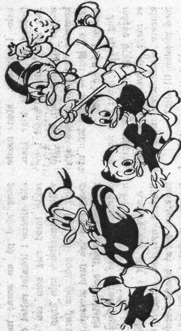
Jeg er af den generation, hvis første ord (som altid) var 'Mor', hvis andet var 'Far' — og hvis tredje og fjerde var 'Anders And'.